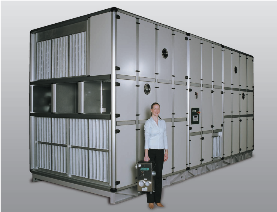
Ob klein, ob groß - wir haben immer den passenden Trockner.